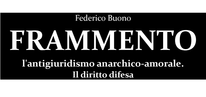
La mia legge, il mio nulla, di Ivan Karamazov

"Questa è la magia dell'estremo.La seduzione che esercita tutto quanto è estremo.Noi immoralisti,noi siamo gli estremi."(1)